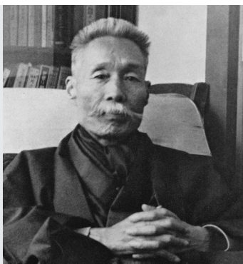
■森田正馬(1874~1938) 東京大学・医学部卒業 東京慈恵会医科大学・名誉教授

不安症の特徴は、不安と恐怖に關連した苦痛があることと、それらによって日常生活に支障をきたしている