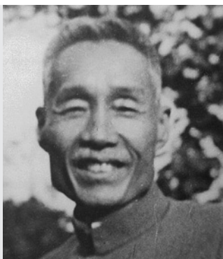
■森田正馬(1874~1938) 東京大学・医学部卒業 東京慈恵会医科大学・名誉教授