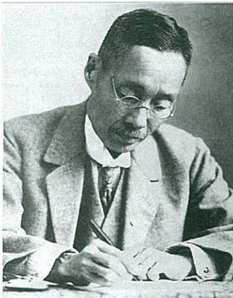
■ 森田正馬博士 (1874~1938年)

森田療法は、東京慈恵会医科大学の初代精神科教授であった森田正馬によって1919年に創始された精神療法(心理療法)です。元来の治療対象は強迫性障害、社交恐怖(社交不安障害、対人恐怖症)や広場恐怖などの恐怖症性不安障害、パニック障害、全般性不安障害、心気障害など、神経症と総称される病態でした。森田療法は次のような人間観に基づいています。そもそも不安とその根源にある死の恐怖は私たちの誰もが有する自然な感情であり、その裏にはよりよく生きようとする人間本来の欲望(生の欲望)が存在します。例えば病気に対する恐れの中には健康への希求があるように、不