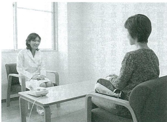
■ 外来治療 (森田療法センター)

見会」も全国で活発な活動を続けており、現代の森田療法は入院、外来、自助グループの連携体制が確立しつつあります。治療対象については、神経症に限らず経過の長引いたうつ病や種々の心身症に森田療法の適用が広げられており、癌の患者さんのメンタルヘルスにも応用されています。